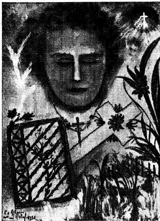
Inspiratie op het mediumschap van Jeanne d'Arc.

De eerste nog eenigszins primitieve crayon-teekeningen gingen in 3 à 4 maanden, via pastel, over in groote olieverf-schilderijen, welke de bewondering van bevoegde kunst-kenners opwekten, ook los van de verbazing over de occulte wijze waarop deze kunst-producten tot stand kwamen. In den laatste tijd worden ook, uit een technisch oog-punt veel lastiger, aquarellen vervaardigd.